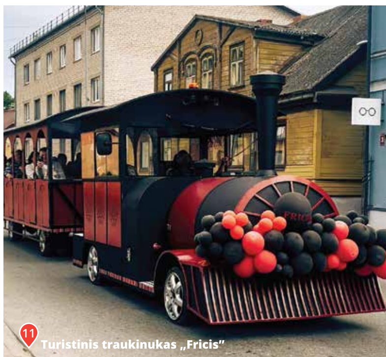
11 Turistinis traukinukas „Fricis“