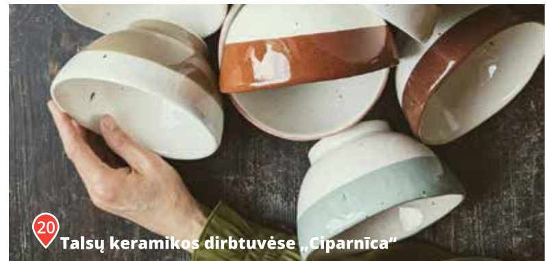
20 Talsu keramikos dirbtuvėse „Ciparnica“