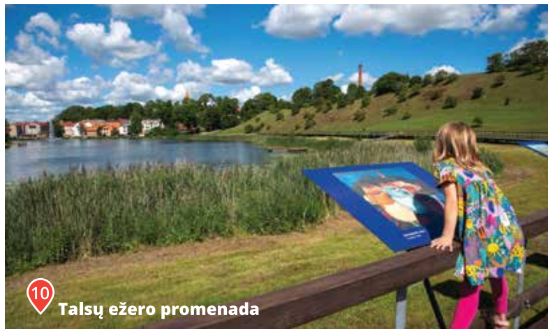
10 Talsu ežero promenada