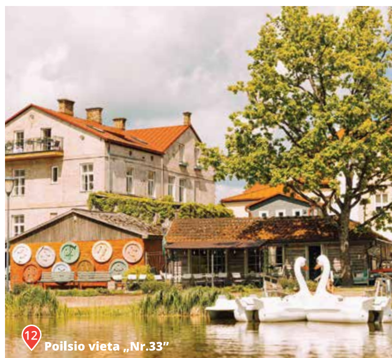
Poilsio vieta „Nr.33“