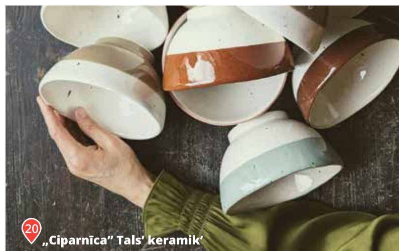
20 „Ciparnīca” Tals' keramik

📍 Baznīcas laukums 4, 📞 29392287, pilsetakalna.lv