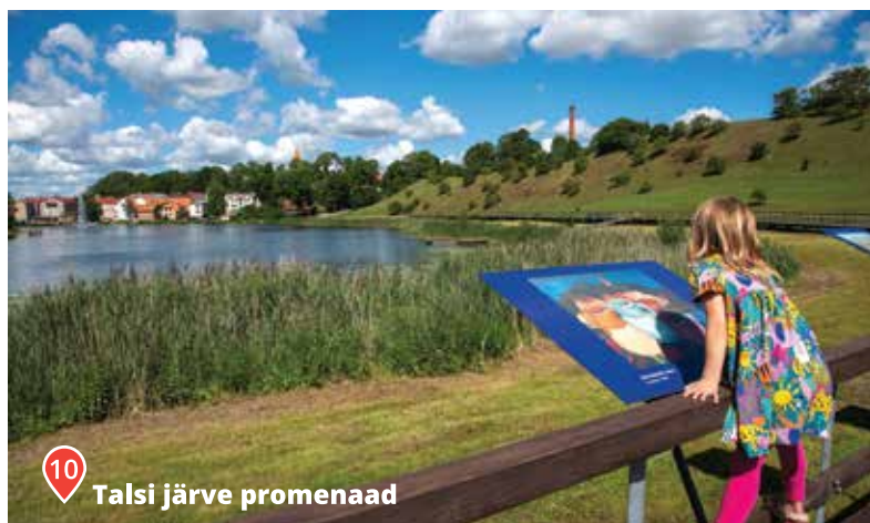
10 Talsi järve promenaad