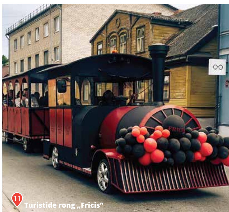
11 Turistide rong „Fricis”