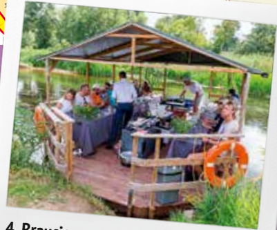
4. Brauciens ar motorizētu plostu pa Abavu