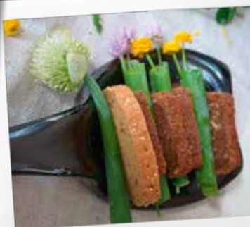
12. Radošā māja "Sarade"