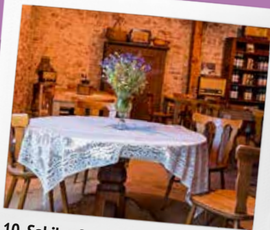
10. Sabiles Sidra darītava