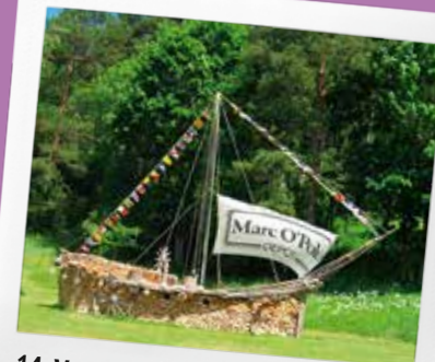
14. Veco laiku muzejs

– Brīvdienu māja "Bungas", "Bungas", Abavas pagasts (starp Valgali un Rendu), 26594639