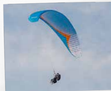
15. Lidojumi ar paraplānu