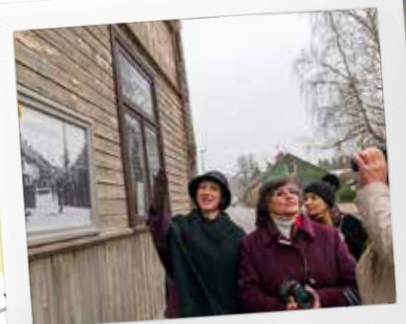
Jaunums! Sabiles "Bilžu galerija" no Ventspils ielas 1/3 līdz Rīgas ielai 34