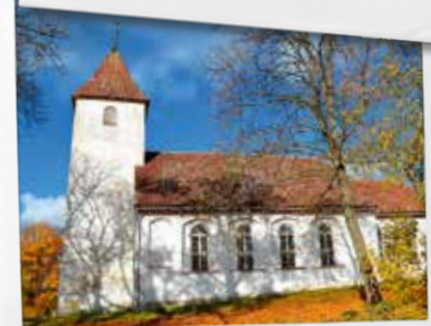
8. Sabiles evaņģēliski luteriskā baznīca