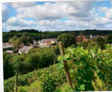
9. Sabiles Vīna kalns

7. Sabiles pilskalns, Talsu iela, Sabile, GPS-57.046993,22.574939