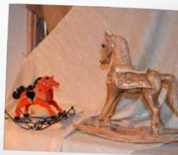
11. Koka rotaļlietu muzejs