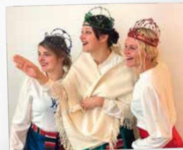
Экскурсия по творческому дворику с Дочерьми Короля

Для заказа фотосессий связываться со свадебными фотографами фотоклуба Талси Александром Тарабановским (Aleksandrs Tarabanovskis) 29417254, Каспарсом Пориньшем (Kaspars Poriņš) 29293672, Дзинтарсом Крастиньшем (Dzintars Krastiņš) 27499173