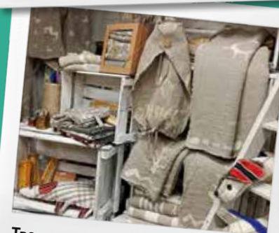
Творческая комната “Patrepe”