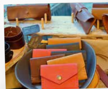
Мастерская кожаных изделий “StoneHill”