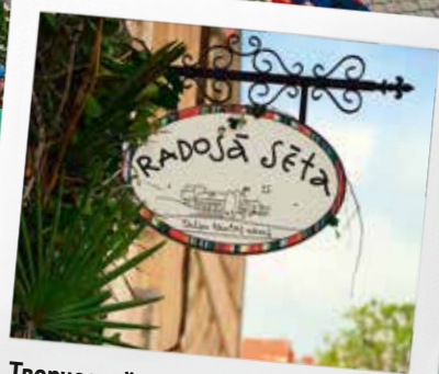
Творческий дворик талсинского Культурного центра

Сердце старого города Талси – творческий дворик талсинского Культурного центра, был построен в 2013 году на средства, привлеченные из Европейского регионального фонда развития. Дворик был отремонтирован и обустроен, и теперь здесь располагаются художники, фотографы, музыканты и мастера различных ремесел. Внутренний двор и террасы на крышах являются отличными местами для проведения концертов, ярмарок и других мероприятий. У посетителей есть замечательная возможность не только увидеть работы местных мастеров-ремесленников, но и создать свой собственный сувенир (договорившись заранее), а также сходить на экскурсию по творческому дворику с одной из Дочерей Короля.