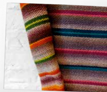
Мастер Класс ткацкой группы “Talse”