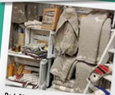
Radošā telpa “Patrepe”