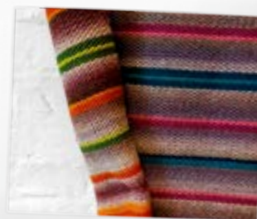
Audēju kopas “Talse” darbnīca