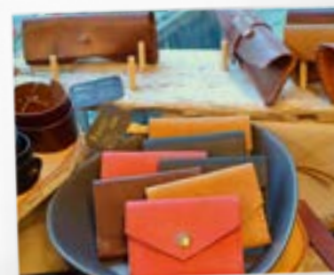
Ādas amatnieku darbība “StoneHill”