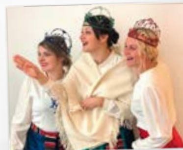
Radošās sētas Ķēniņmeitas