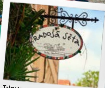
Talsu tautas nama Radošā sēta

Vecpilsētas sirds ir Talsu tautas nama Radošā sēta, kas izbūvēta 2013. gadā, piesaistot Eiropas Reģionālā attīstības fonda finansējumu un iegūstot modernu iekšpagalmu, kuru apdzīvo amatnieki, fotogrāfi, mūziķi un mākslinieki. Jumta terases un pagalms ir lieliskas koncertu, tirdziņu un citu pasākumu norises vietas. Apmeklētājiem ir iespēja apskatīt vietējo amatnieku darbus un ar iepriekšēju pieteikšano arī pašiem izgatavot sev suvenīru, kā arī doties Radošās sētas iepazīšanas tūrē kopā ar kādu no Radošās sētas Ķēniņmeitām.